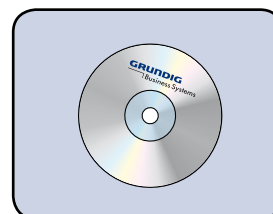
Inklusive Software DigtaSoft und ...