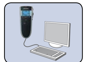
... USB-Audio zum Diktieren am PC