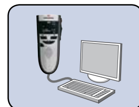
USB-Audio zum Diktieren am PC