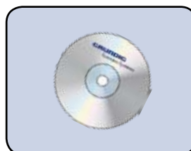
Inklusive Software DigtaSoft