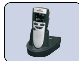
Mit Digta Station